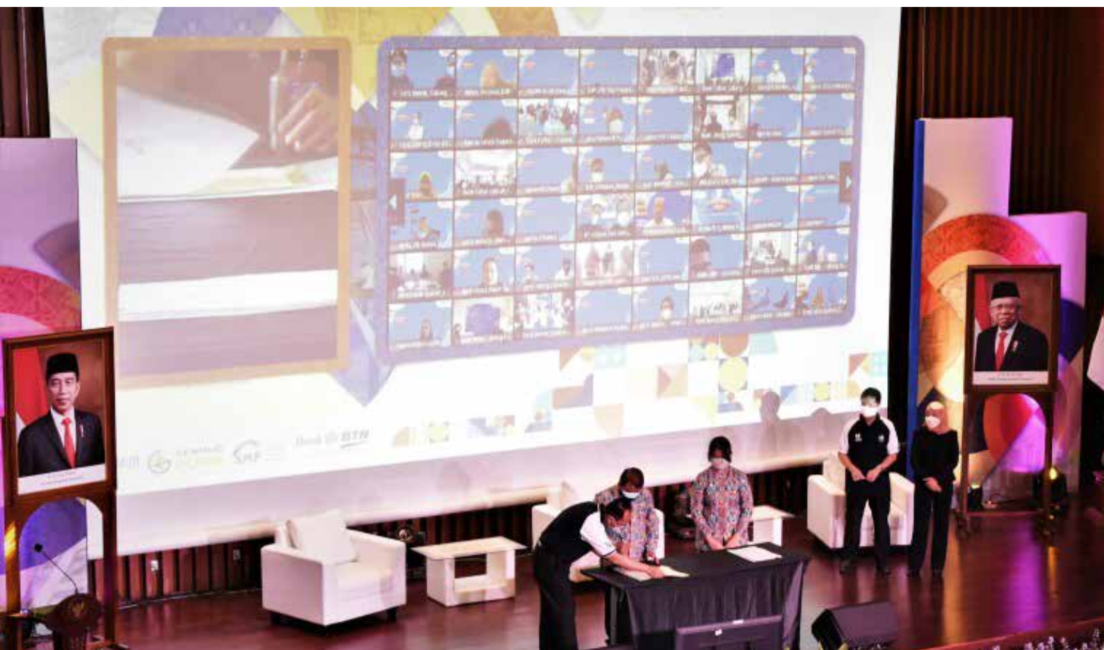
Akad massal KPR 7.500 debitur yang dilaksanakan BTN bersama Kementerian PUPR, secara daring pada 25 Agustus 2021.

"Kami alokasikan dana APBN Rp5 triliun untuk mendorong pembangunan rumah melalui Direktorat Jenderal Perumahan dan Rp28,2 triliun untuk pembiayaan perumahan dengan kerja sama dengan bank penyalur kredit bersubsidi seperti BTN, BPD, BRI dan bank swasta nasional lainnya, serta BP Tapera," katanya.