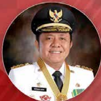
Herman Deru Gubernur Sumatera Selatan