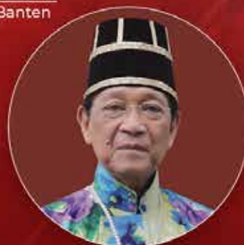
Sri Sultan Hamengkubuwana X Gubernur D.I. Yogyakarta