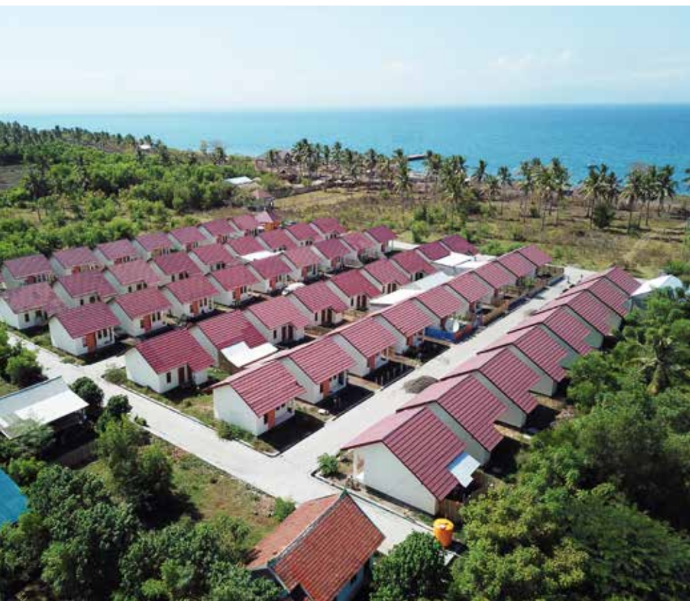
Program Sejuta Rumah yang dikerjakan Kementerian PUPR.