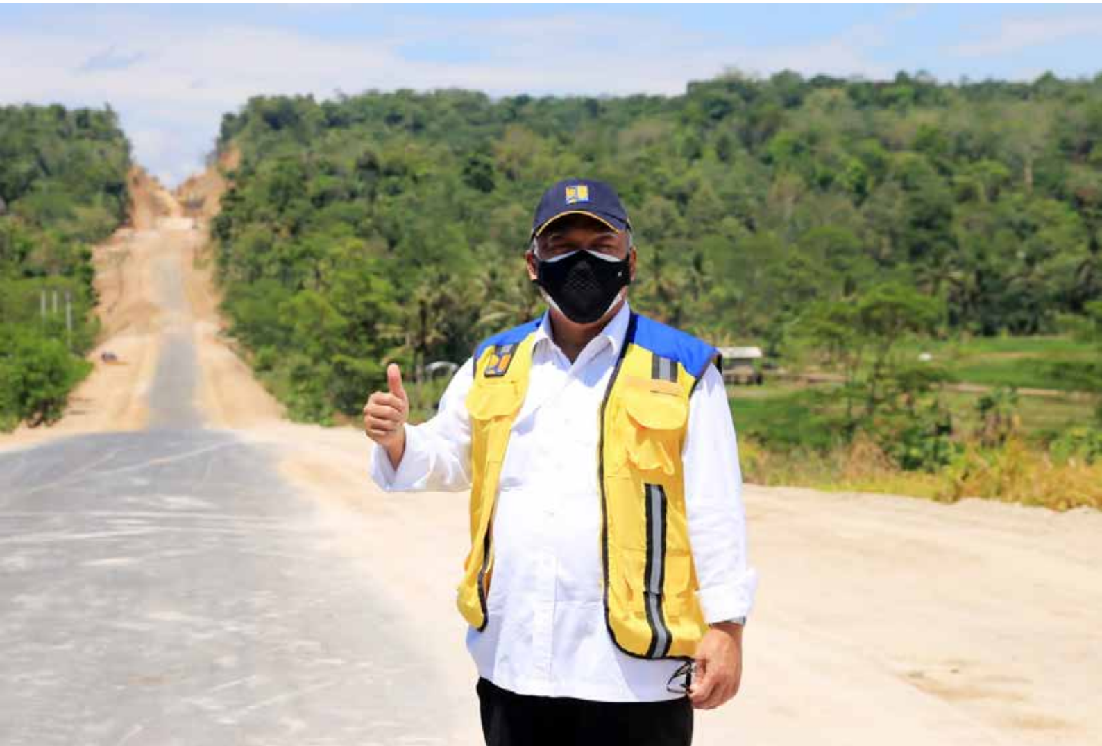
Menteri PUPR, Basuki Hadimuljono.

"Di sisi lain, BTN juga kerja sama dengan developer mitra BTN dengan pembuatan program menarik, yang diharapkan dapat meningkatkan animo masyarakat kepada penjualan properti