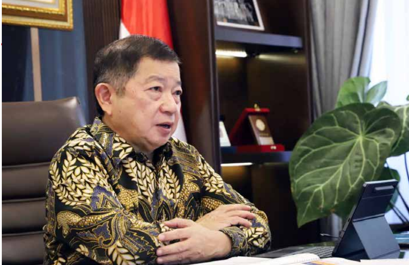
Menteri Perencanaan Pembangunan Nasional/Kepala Bappenas, Suharso Monoarfa.