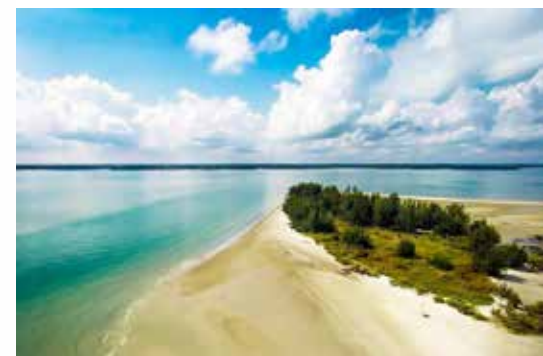
Pulau Beting Aceh.