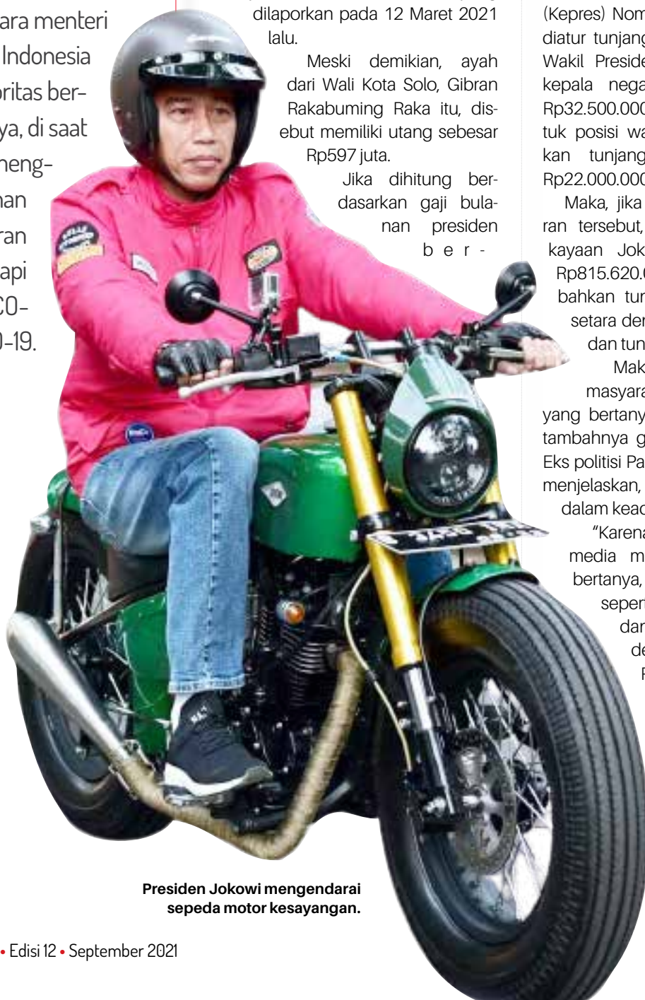
Presiden Jokowi mengendarai sepeda motor kesayangan.