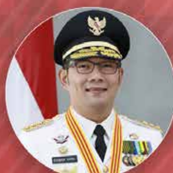
Ridwan Kamil Gubernur Jawa Barat