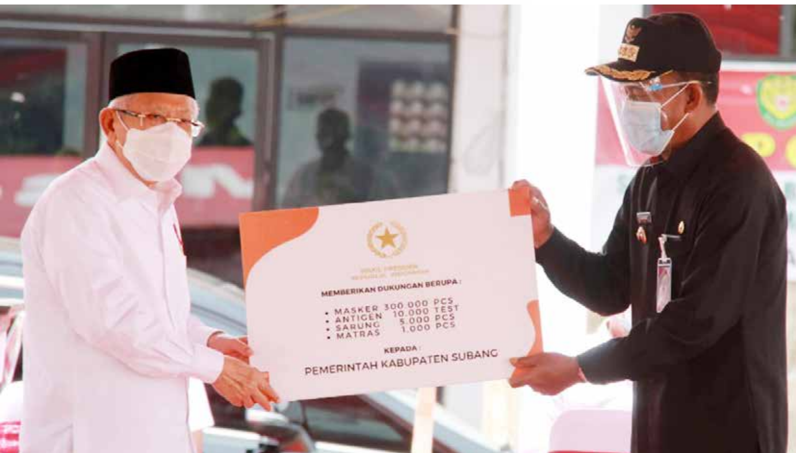
Wakil Presiden Maruf Amin memberikan bantuan untuk korban banjir Subang.

Menurutnya, LHKPN yang dipublikasikan KPK, belum bisa dipertang-