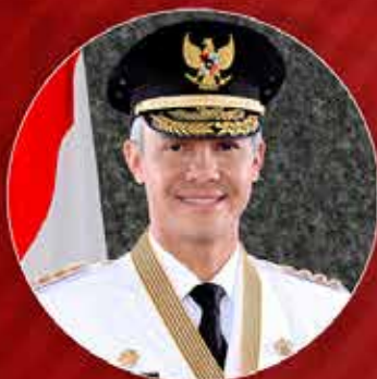
Ganjar Pranowo Gubernur Jawa Tengah