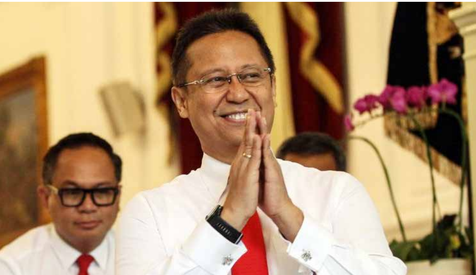
Menteri Kesehatan Budi Gunadi Sadikin.