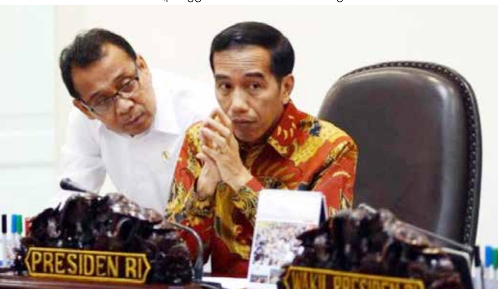
Presiden Joko Widodo bersama Mensesneg Pratikno.