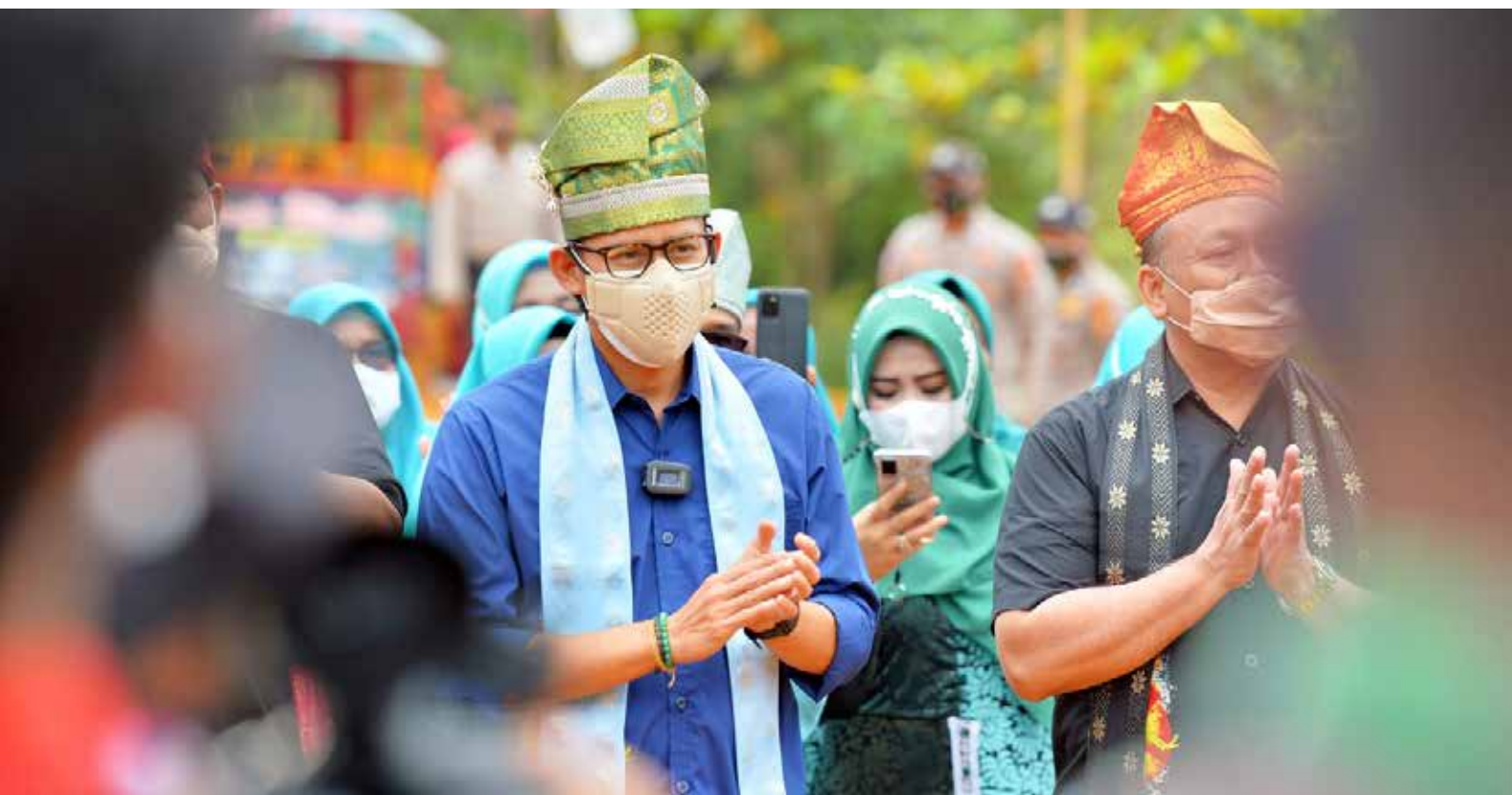
Menteri Pariwisata dan Ekonomi Kreatif, Sandiaga Uno saat berkunjung ke Riau, 12 September 2021 lalu.

Kelenteng ini telah berumur sekitar 123 tahun. Layaknya kelenteng pada umumnya, warna merah mendominasi bangunan peribadahan umat Buddha itu. Menariknya, kelenteng ini dibangun persis menghadap Selat Morong yang dipercaya membawa keberuntungan sesuai kata fengshui.