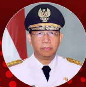
Sutarmidji Gubernur Kalimantan Barat