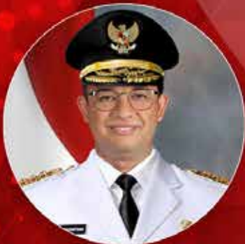
Anies Baswedan Gubernur DKI Jakarta

Polling Gubernur Untuk Negeri memasuki tahap final Mulai sekarang, kami menampilkan nama-nama yang berhasil menduduki 10 besar pada hasil polling kedua.