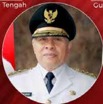
Isran Noor Gubernur Kalimantan Timur