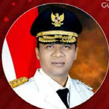
Zulkieflimansyah Gubernur Nusa Tenggara Barat