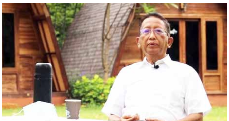
Ketua Satuan Tugas (Satgas) COVID-19 Ikatan Dokter Indonesia (IDI), Zubairi Djoerban.

Zubairi menyatakan, situasi pandemi yang membaik ini adalah momentum tepat untuk mempersiapkan transisi. Syaratnya harus ada koordinasi yang solid semua pihak dan tidak boleh menurunkan kewaspadaan.