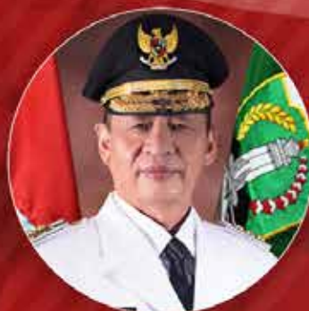
Wahidin Halim Gubernur Banten