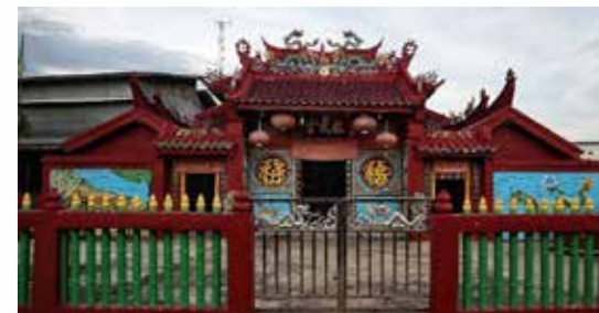
Kelenteng Cin Buk Kiong.

Lokasi ini menjadi tempat penyelenggaraan ritual budaya, yaitu tradisi mandi safar yang diadakan setiap tahun. Upacara ini bertujuan untuk menolak bala ataupun bencana yang diikuti oleh anak-anak yang merupakan perwakilan dari masing-masing desa di Kecamatan Rupat Utara.