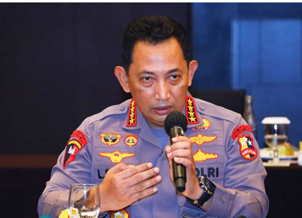
Kapolri Jenderal Pol Listyo Sigit Prabowo

Di sisi lain, Kapolri Jenderal Pol Listyo Sigit Prabowo mengatakan,