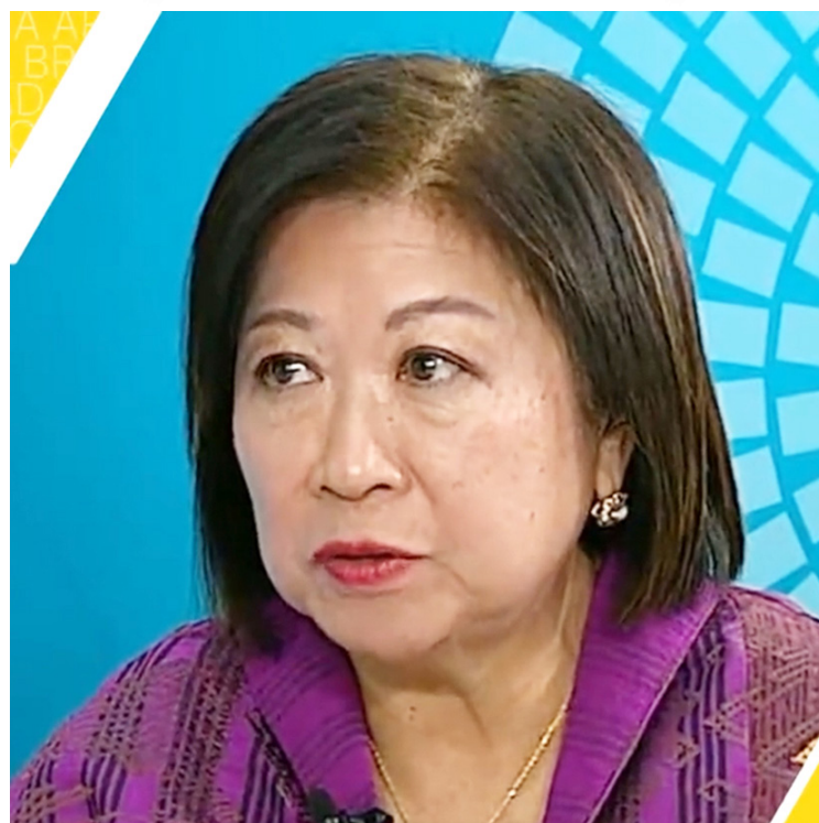
Mari Elka Pangestu

Bagaimana hasil ujian ketahanan pangan ini? Paling cepat hasilnya baru diketahui pada akhir kuartal II (Agustus) 2022. Bolehlah melihat tandatanya pada penutupan semester I (Juni) 2022. Apakah harga beras stabil atau naik, dan bagaimana implikasinya? Kita saksikan bersama-sama. ●