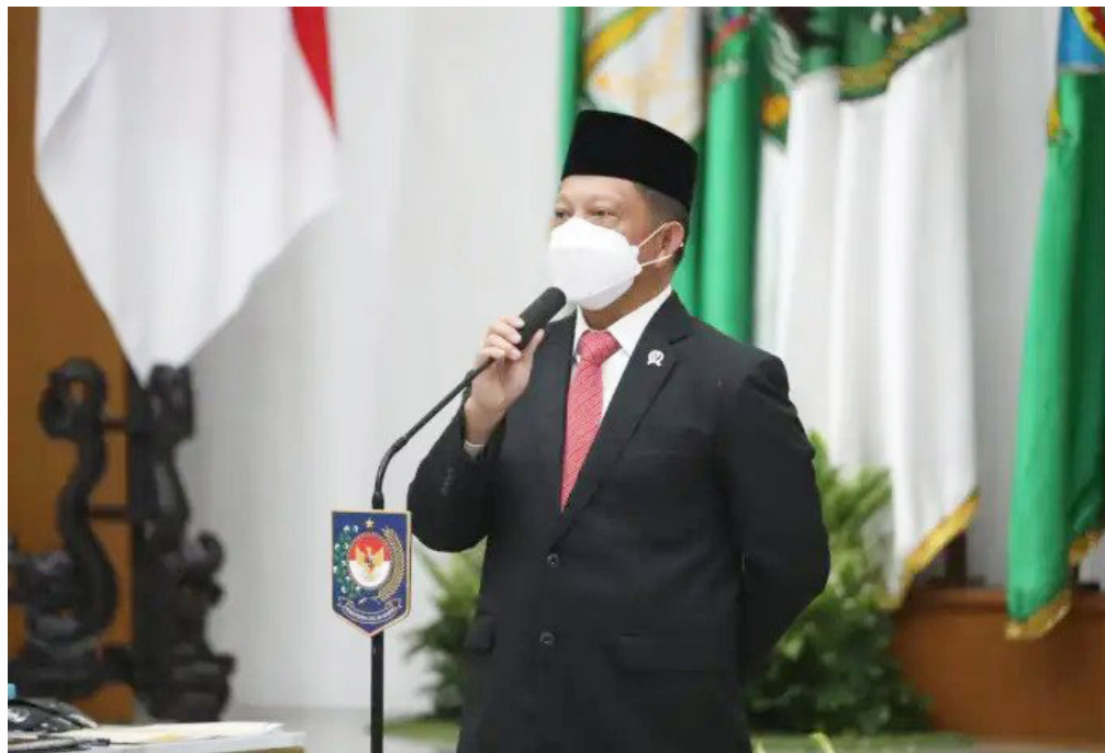
Mendagri, Tito Karnavian

"Termasuk juga memitigasi berbagai potensi masalah yang muncul di lapangan," ujar Juri.