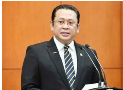
Oleh: Bambang Soesatyo Ketua MPR RI Kandidat Doktor Ilmu Hukum Unpad Dosen Fakultas Hukum, Ilmu Sosial, dan Ilmu Politik (FHISIP) Universitas Terbuka

Bahkan, apresiasi setinggi-tingginya layak diberikan kepada komunitas petani tanaman pangan. Berkat pengabdian