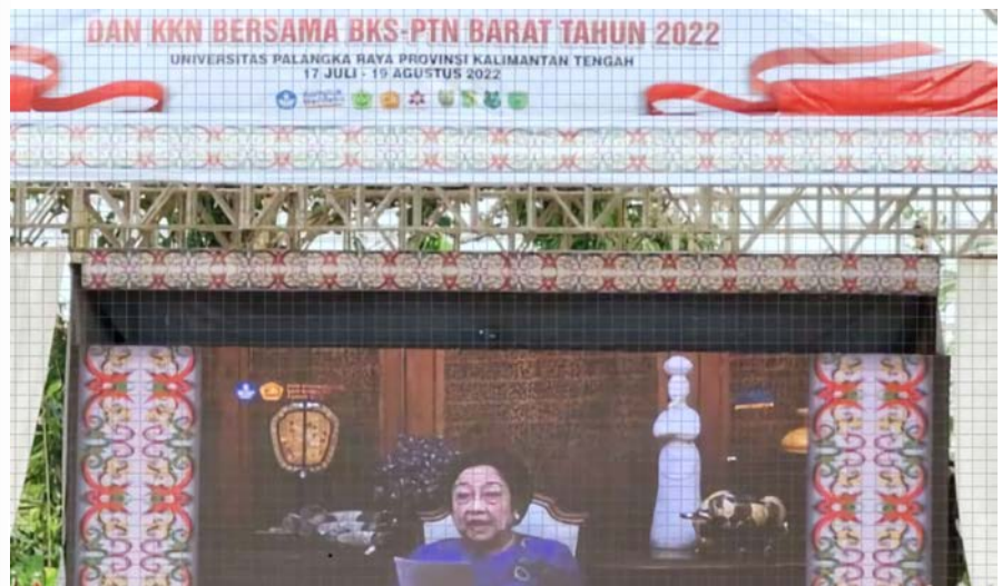
Presiden kelima RI, Megawati Soekarnoputri

Nah, di Indonesia, krisis ekonomi dan politik Sri Lanka mendapat perhatian besar dari para aktivis dan tokoh pengkritik Presiden Joko Widodo. Wacana yang berkembang, situasi di dalam negeri sama dengan Sri Lanka. Bahkan ada yang meyakini Jokowi