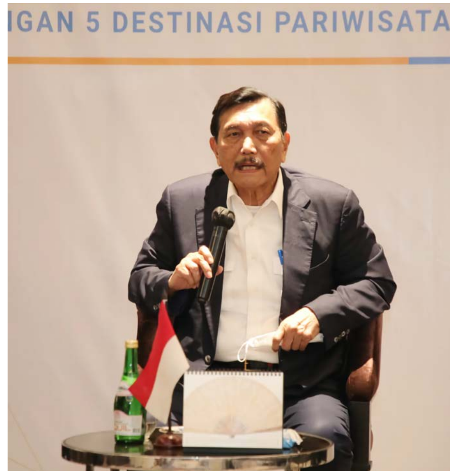
Menteri Koordinator Bidang Maritim dan Investasi Luhut Binsar Pandjaitan

"Jangan membohongi rakyatnya. Saya enggak suka melihat itu. Jadi untuk dia populer, dia bikin berita-berita bombastis yang membohongi rakyat. Itu saya pikir tidak adil dan tidak benar,"