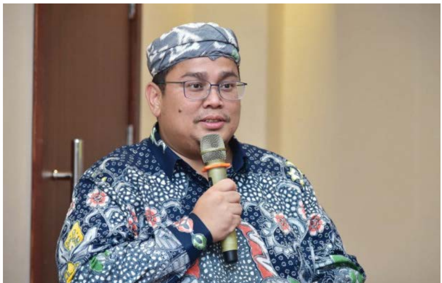
Ketua Bawaslu, Rahmat Bagja

"Sebenarnya menteri kita punya etika, tetapi bukan berarti itu sesuatu yang boleh dilakukan. Kalau punya etika yang baik, teman nyolong anda tidak akan ikut nyolong. Menurut saya, menyalahkan orang lain yang etika buruk bukan berarti Zulhas benar," ujarnya. ●