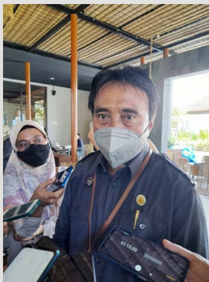
Kepala BPS NTB, Wahyudin.

Penonton yang datang dari provinsi selain NTB, rata-rata berada di NTB selama 6 hari. Penonton dari Pulau Lombok rata-rata berada di Kabupaten Sumbawa selama 3 hari. Penonton dari Pulau Sumbawa, selain Kabupaten Sumbawa rata-rata berada di Kabupaten Sumbawa selama 2 hari. ● prn/***