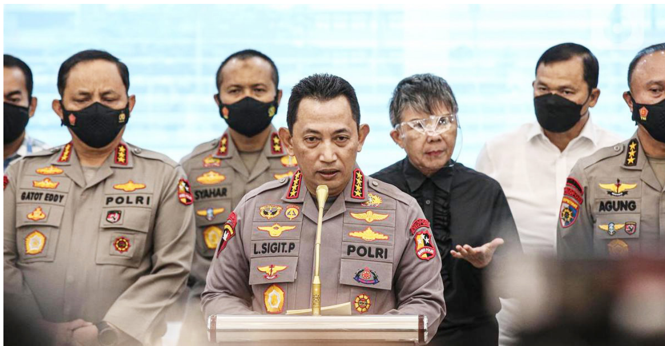
Kapolri Jenderal Listyo Sigit Prabowo

Untuk itu, Presiden mengingatkan kepada seluruh jajaran Polri untuk memiliki kepekaan terhadap situasi krisis (sense of crisis) yang sama. Presiden juga mengingatkan agar jajaran Polri bisa lebih memperhatikan gaya hidupnya agar tidak menimbulkan kecemburuan sosial dan menjadi soro-