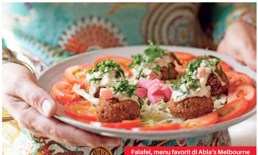
Falafel, menu favorit di Abla's Melbourne

Hidangan Timur Tengah ini bisa dimulai dengan kacang tumbuk kerang atau Coleslaw Timur Tengah yang menggugah selera. Lalu beralih ke Zingy, Tagine domba lembut dengan lemon yang diawetkan, zaitun