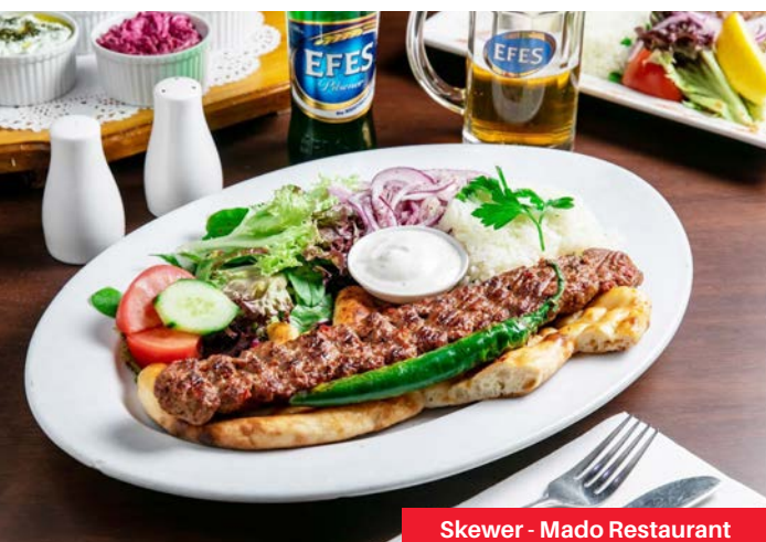
Skewer - Mado Restaurant