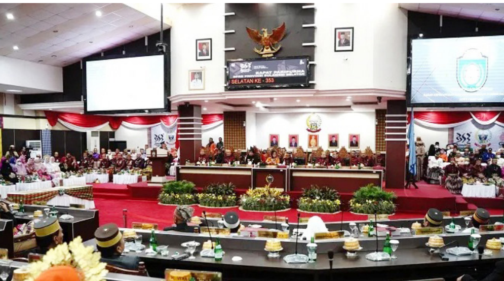
Rapat Paripurna DPRD Sulsel dalam rangka peringatan hari jadi Sulsel ke_353