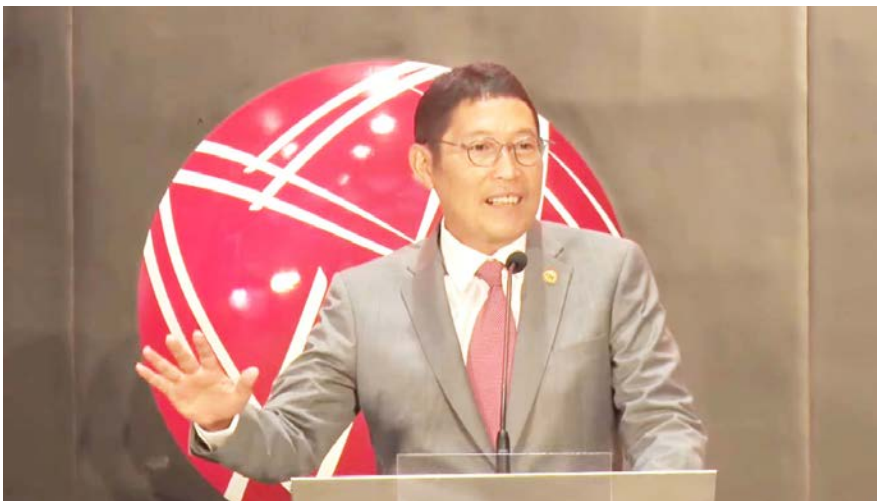
Kepala Eksekutif Pengawas Pasar Modal OJK, Inarno Djajadi

Meski optimistis, ia menegaskan Indonesia tetap waspada mengingat yang terjadi selama 2,5 tahun pandemi ini meninggalkan scarring effect terhadap perekonomian dari sisi suplai. Sektor produksi belum bisa langsung cepat merespons permintaan, sehingga