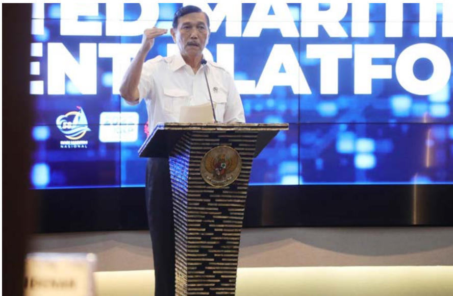
Menteri Koordinator Kemaritiman dan Investasi, Luhut Binsar Pandjaitan

Tiga bulan lalu, pada Juli 2022, IMF lebih optimistis ketimbang saat ini. Kala itu, resesi diperkirakan hanya akan men-