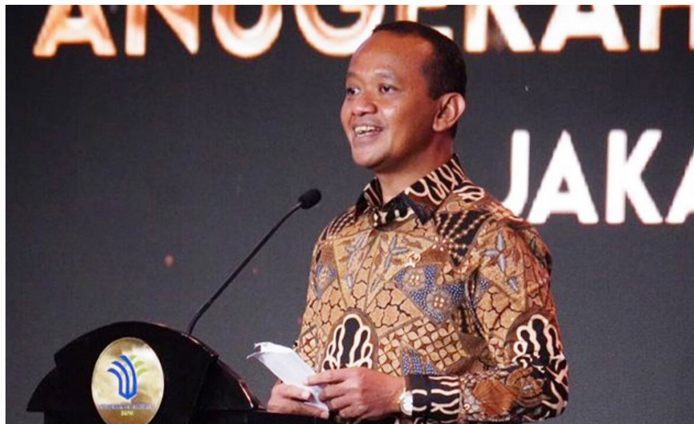
Menteri Investasi Kepala BKPM, Bahlil Lahadalia

temuan tersebut, Blair juga sempat menyampaikan sejumlah pemikiran terkait strategi promosi yang dapat dilakukan pemerintah Indonesia. Pemerintah Indonesia dapat melakukan promosi ke beberapa negara lain, seperti