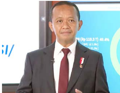
Oleh: Bahlil Lahadalia Menteri Investasi/Kepala Badan Koordinasi Penanaman Modal

Namun, valuasi dampak ekonomi dari investasi ser-