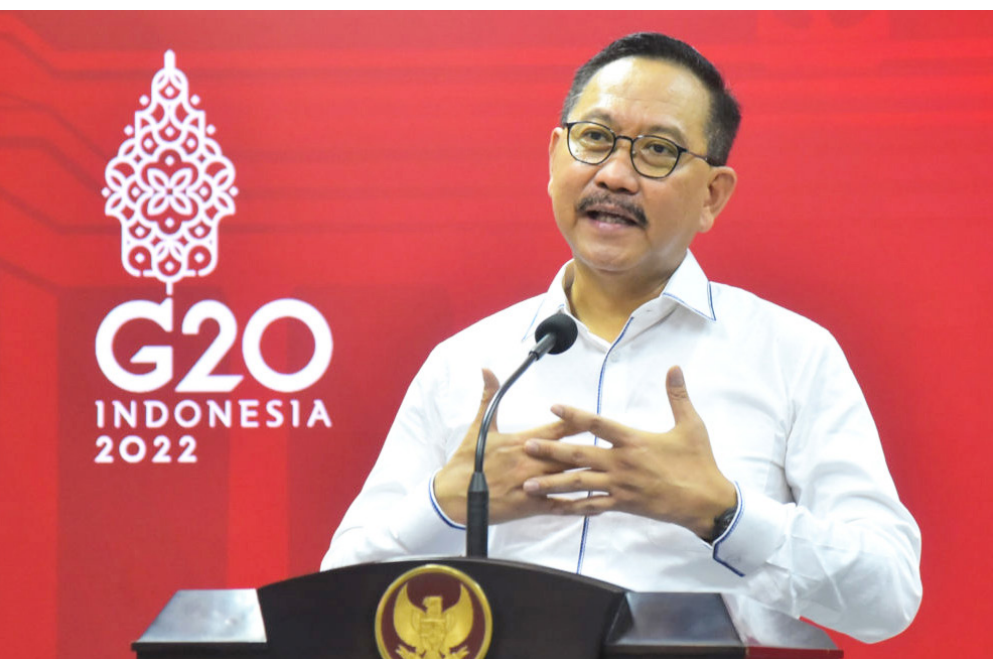
Kepala Otorita IKN, Bambang Susantono

Bambang menuturkan dari sembilan kawasan pembangunan yang direncanakan, fokus saat ini adalah pembangunan kawasan pusat pemerintahan.