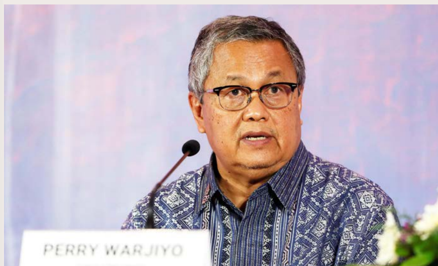
Gubernur Bank Indonesia, Perry Warjiyo