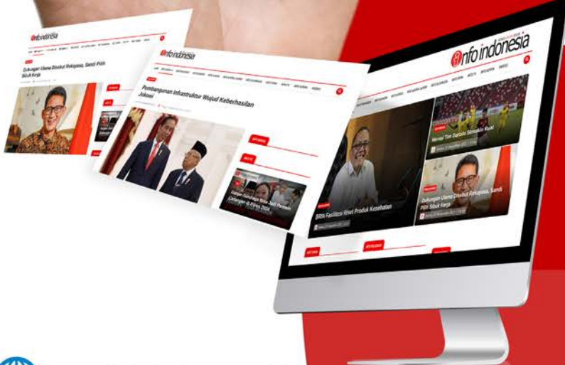
Koran Cetak Info Indonesia

Lautan informasi di dunia maya melalui jaringan internet memberikan banyak referensi info kepada masyarakat Sumsel