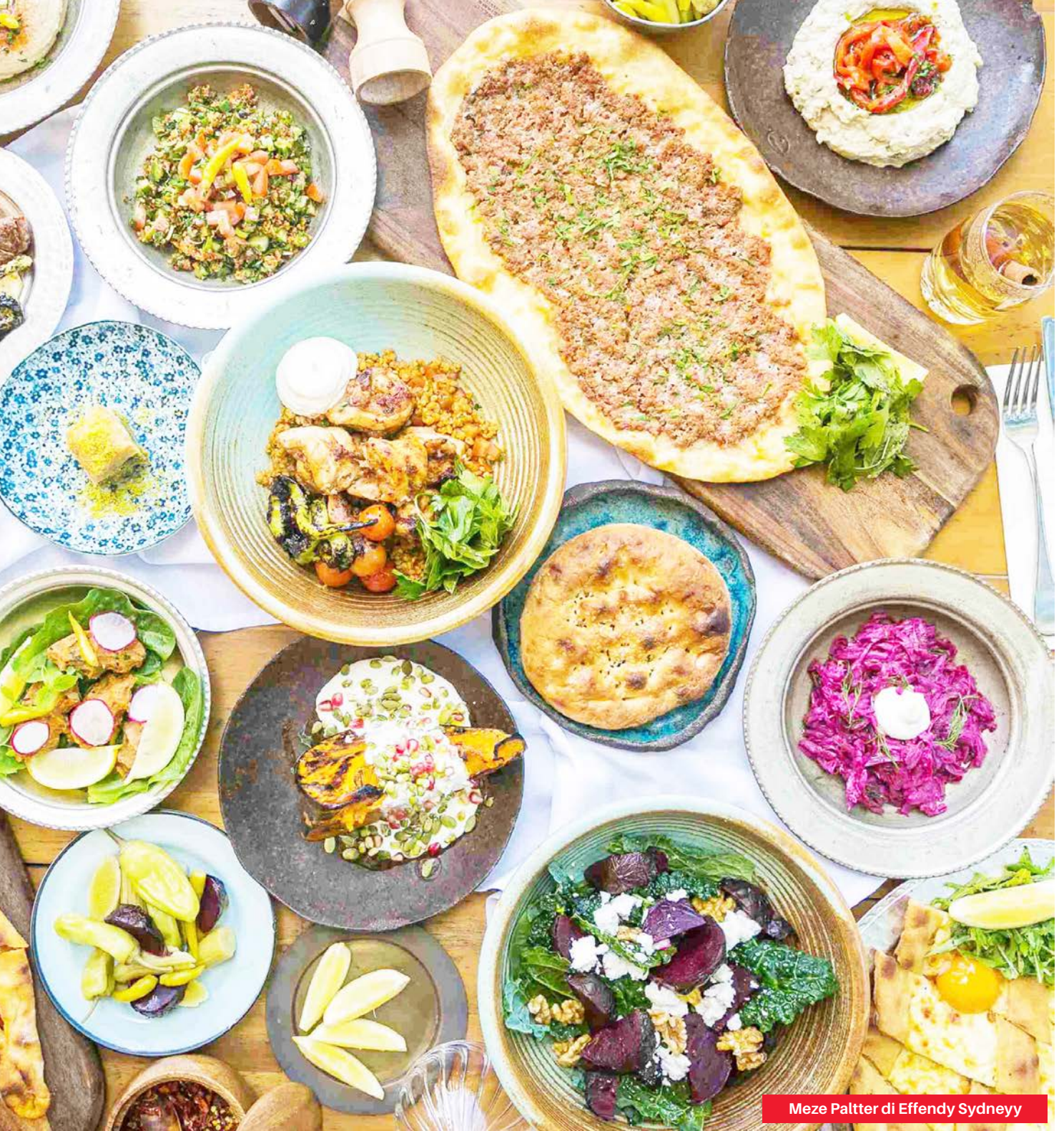
Meze Paltr di Effendy Sydney