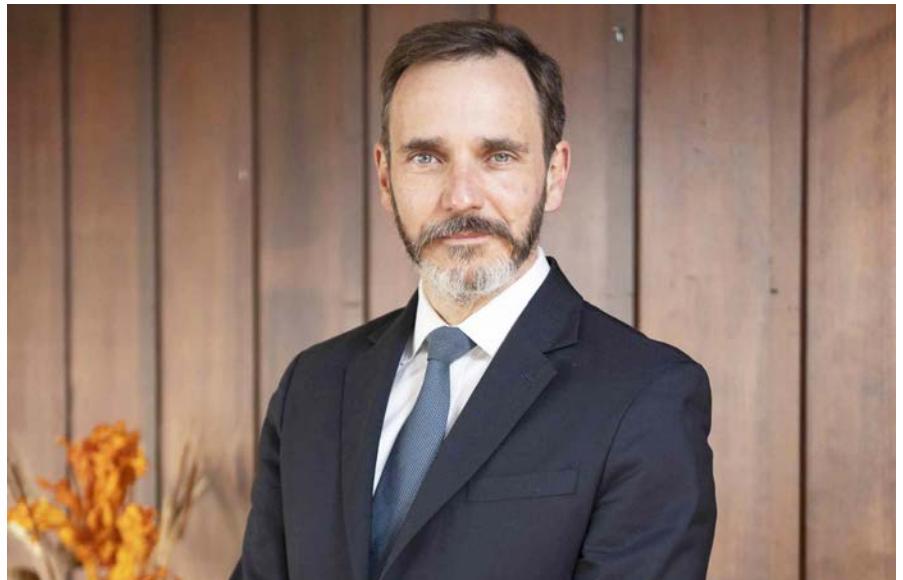
Kepala Ekonom IMF, Pierre-Olivier Gourinchas

Turunnya ekspor September merupakan pembalikan setelah bulan sebelumnya tumbuh 9 persen secara bulanan. Kontraksi tersebut juga lebih dalam dibandingkan September 2021 yang turun hanya 3,8 persen secara bulanan.