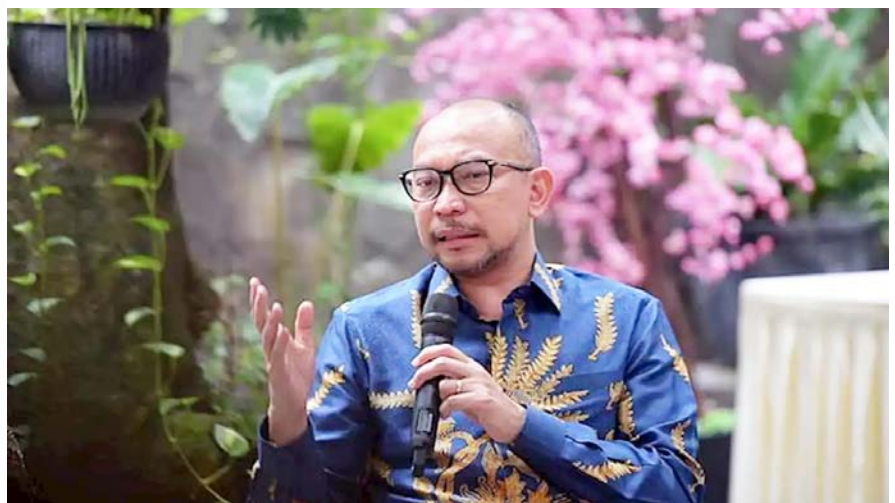
Mantan Menteri Keuangan, Chatib Basri

"Di Indonesia, permintaan kebutuhan energi dalam negeri masih bisa dipenuhi dengan rantai pasok yang ada dan tidak terdampak langsung oleh perang Rusia dan Ukraina, meski dampak kenaikan harga energi juga turut dirasakan karena kenaikan harga minyak dunia. Sementara itu, krisis komoditas pangan yang terjadi pada gandum, tidak berdampak ekstrem karena memang bukan makanan pokok Indonesia," ujar Deddy dalam keterangan tertulis Humas SBM ITB, Sabtu, 15 Oktober 2022.