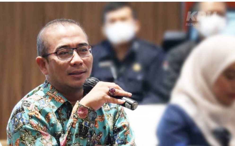
Ketua KPU, Hasyim Asy'ari