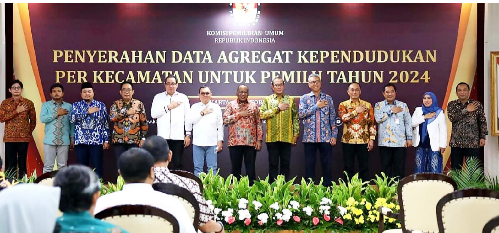
Kegiatan penyerah DAK2 dari Kemendagri ke KPU RI