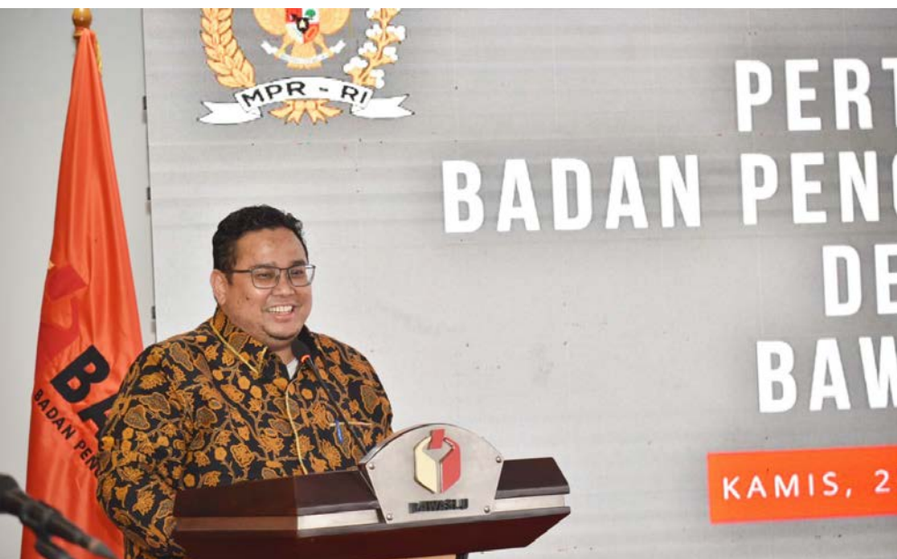
Ketua Bawaslu, Rahmat Bagja

pemilu juga dituntut untuk selaras dengan pengembangan teknologi informasi. Hal itu diwujudkan dalam verifikasi faktual melalui konferensi video jika partai politik tidak dapat menunjukkan susunan kepengurusan dan keterwakilan perempuan minimal 30 persen.