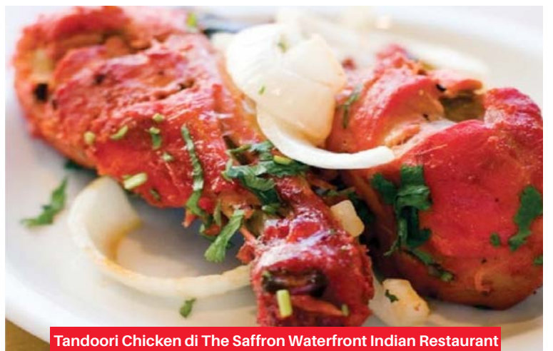
Tandoori Chicken di The Saffron Waterfront Indian Restaurant