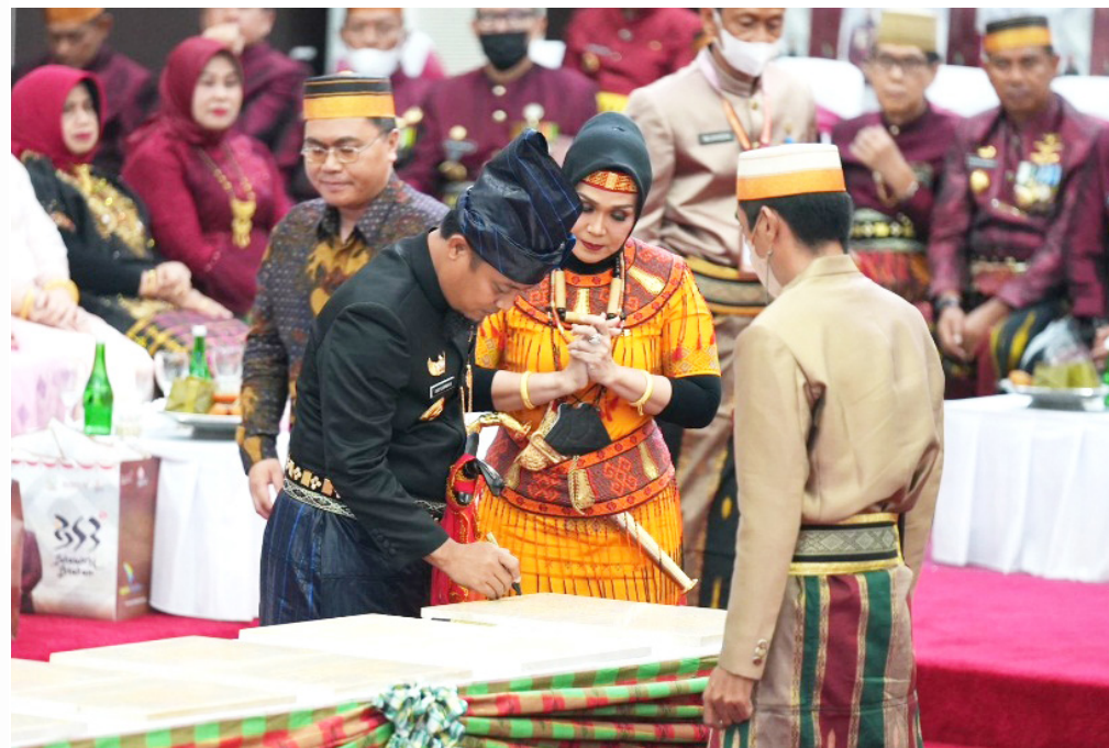
Penandatanganan Prasasti Teknologi Pengolahan Arsinum oleh Gubernur Andi Sudirman pada Rapat Paripurna DPRD Sulsel, Rabu, 19 September 2022.

menghubungkan Kabupaten Luwu dengan Kabupaten Toraja Utara terus dilakukan, pembukaan jalur Parigi - Bungoro yang menghubungkan Kabupaten Bone, Barru dan Pangkep.