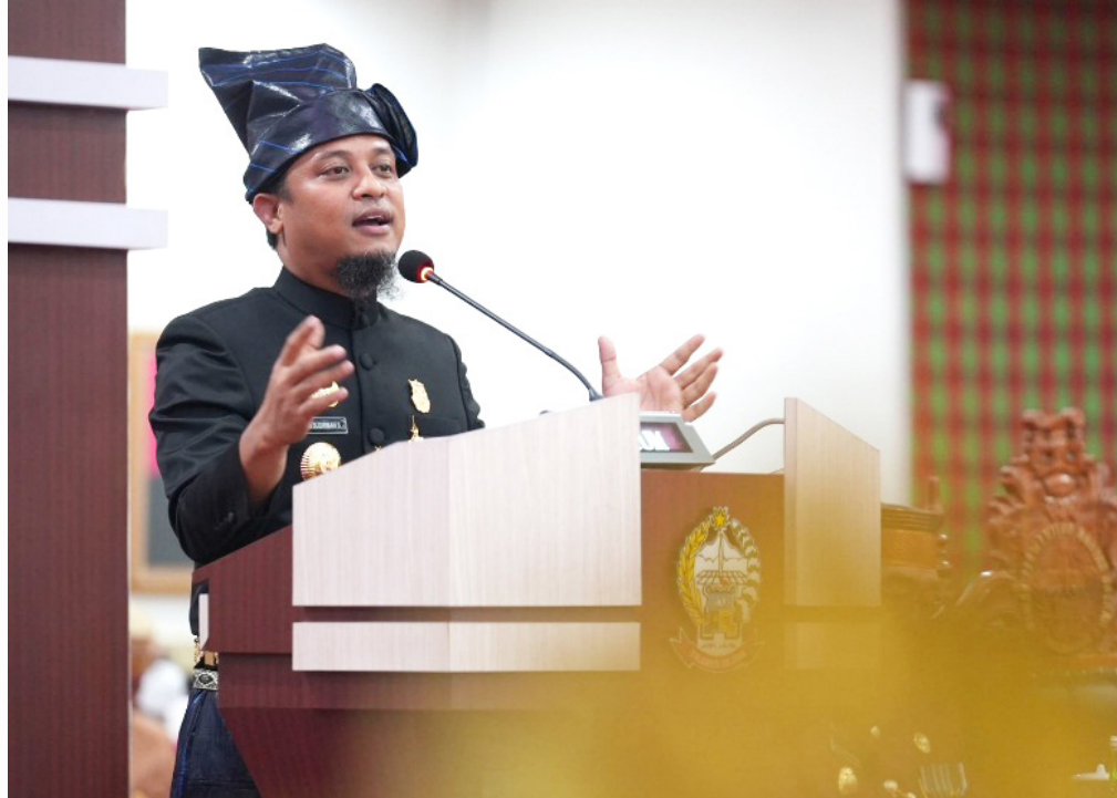
Gubernur Sulsel Andi Sudirman Sulaiman

Serta ruas terisolir lainnya, yang membuka akses rintisan yang mempersingkat jarak Kabupaten Barru dengan Kabupaten Soppeng melalui pembangunan ruas Takkalasi - Bain-