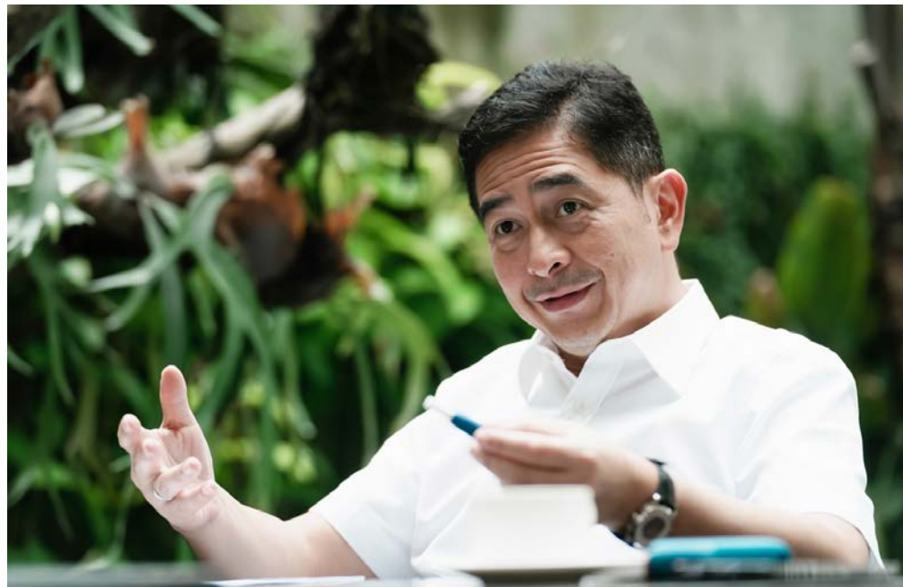
Ketua Umum Kadin Indonesia, Arsjad Rasjid

Kehadiran IKN Nusantara di Pulau Kalimantan akan menggeser pusat