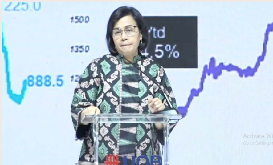
Menteri Keuangan, Sri Mulyani Indrawati

Sri Mulyani mengakui keberagaman anggota G20 merupakan dinamika yang bisa menghambat terjadinya kesepakatan dalam merespon isu global, meski hal tersebut juga bisa menjadi