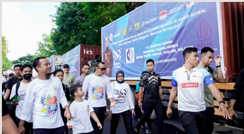
Pelepasan ekspor produk andalan Sulsel ke 10 negara tujuan.

minal Petikemas Makassar, Kantor Wilayah Bea dan Cukai Sulawesi Selatan, Balai Besar Karantina Perikanan, Balai Besar Karantina Pertanian dan pelaku usaha ekspor.