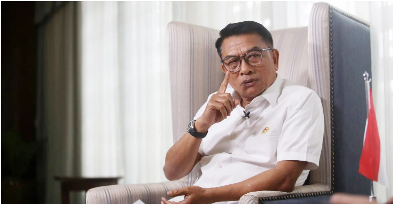
Kepala Staf Kepresidenan, Moeldoko

"Entah polisi terhadap oknum polisi, terhadap masyarakat, itu menjadi perhatian bagi masyarakat. Untuk itu, saya pribadi dan juga saya rasa masyarakat yang lain tentu sangat mengapresiasi adanya pembenahan dalam tubuh Polri," ujarnya.