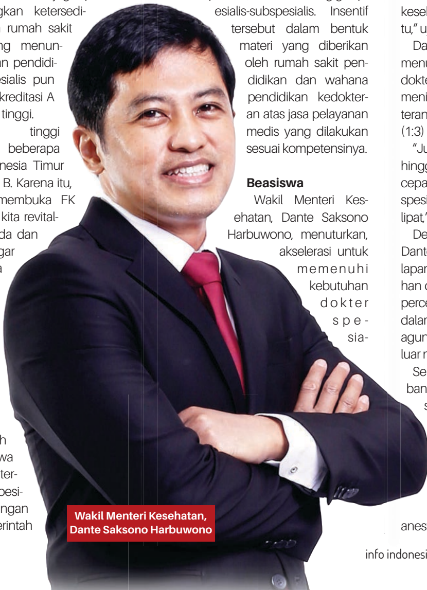
Wakil Menteri Kesehatan, Dante Saksono Harbuwono

Sepanjang 2016-2021, tercatat sebanyak 163 dokter spesialis WNI lulusan luar negeri yang telah didayagunakan. Yang terbanyak adalah spesialis anak (42 orang), spesialis obstetri dan ginekologi (37 orang), spesialis penyakit dalam (24 orang), spesialis dermatologi-venerologi (17 orang), spesialis anesthesiologi (15 orang), dan lainnya. •