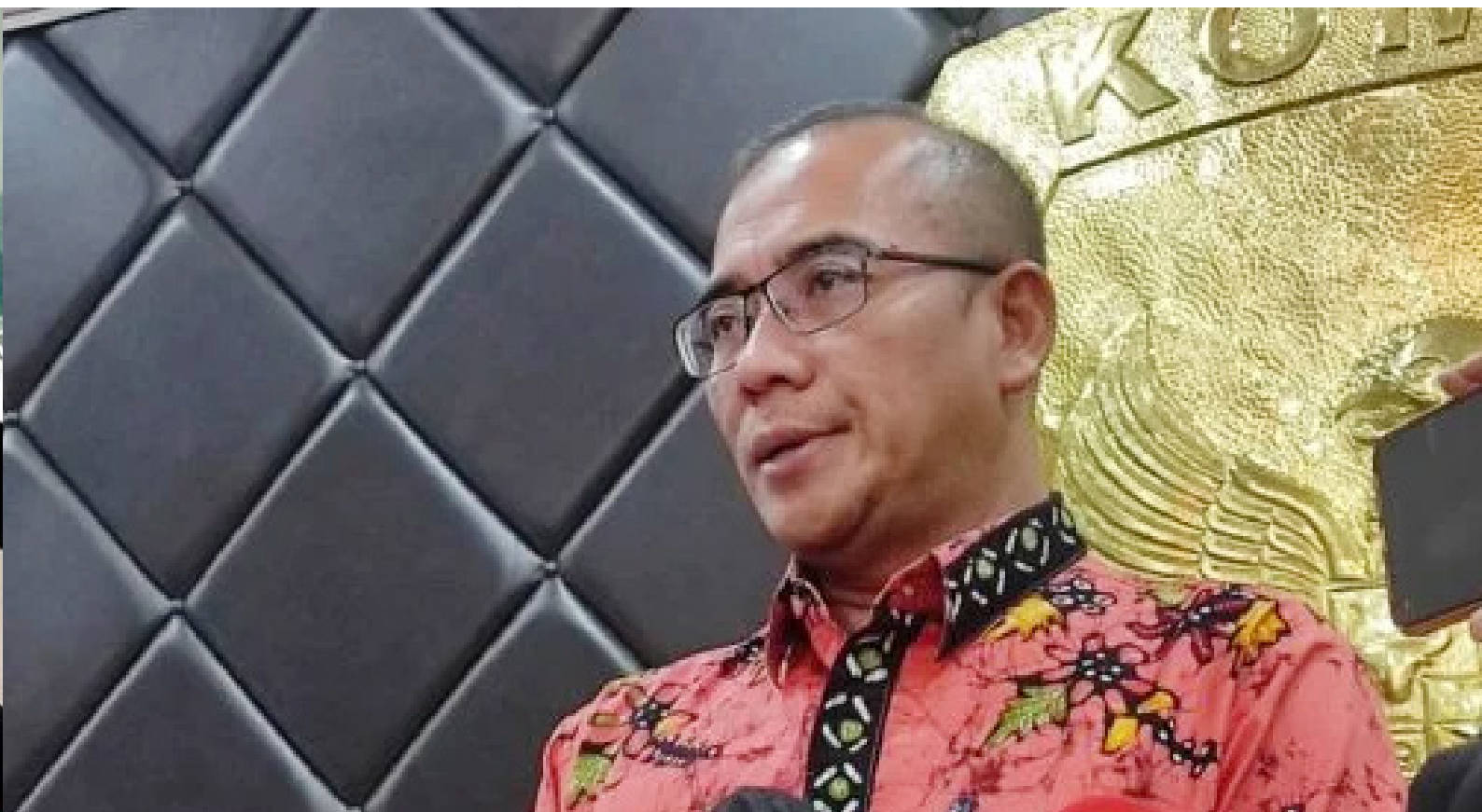
Ketua KPU Hasyim Asy'ari

jadi peserta Pemilu 2024. Ia menduga, ada kekuatan besar yang berusaha menyingkirkan partainya sebagai peserta kontestasi politik pada 2024.