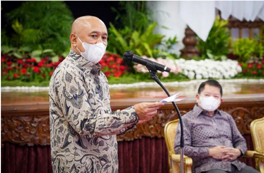
Menteri Koperasi dan UKM, Teten Masduki

“Di bidang hilirisasi kita melakukan berbagai kebijakan perpajakan dan insentif dari mulai tax holiday, tax allowance, super deduction yang juga diberikan supaya industri hilirisasi bisa kom-