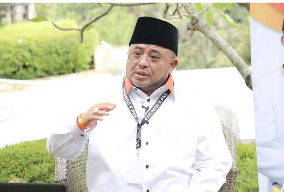
Sekretaris Jenderal PKS, Habib Aboe Bakar Al-Habsyi