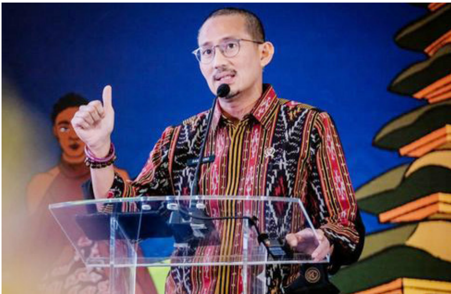
Menteri Pariwisata dan Ekonomi Kreatif, Sandiaga Uno

Dia mengatakan, peran koperasi sebagai agregator dan offtaker dengan dukungan pembiayaan dengan bunga enam persen, lebih meningkatkan kesejahteraan pelaku usaha mikro dan kecil.