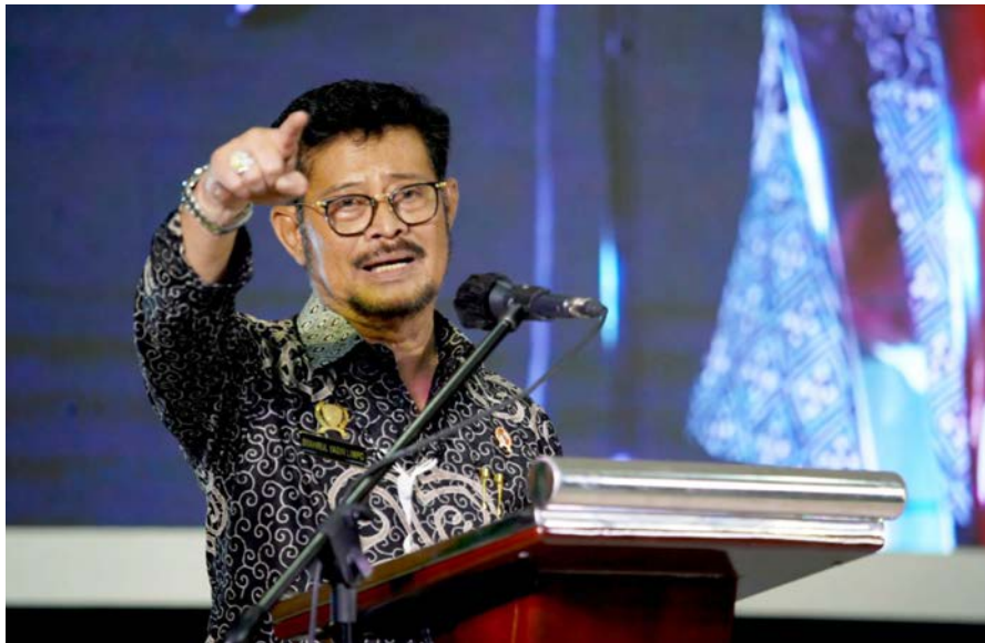
Menteri Pertanian, Syahrul Yasin Limpo

Dengan adanya pertanian yang mumpuni, lowongan kerja bisa terserap lebih banyak, juga sektor ekonomi dan industri lain dapat berjalan den-