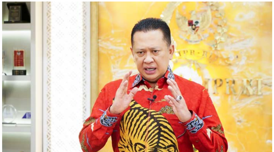
Ketua MPR, Bambang Soesatyo

"Mereka tidak mau berhenti, tidak mau kehilangan jabatan, kekuasaannya tidak mau memudar, maka mereka