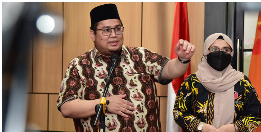
Ketua Bawaslu RI Rahmat Bagja

Sedangkan Ketua KPU Hasyim Asy'ari mengemukakan lembaganya mekanisme pengawasan internal yang akan menindaklanjuti laporan kecurangan