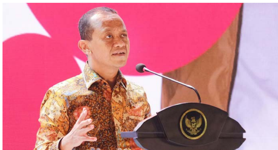
Menteri Investasi/Kepala BKPM, Bahlil Lahadalia

Dia khawatir jika pelaksanaan Pemilu 2024 tetap dipaksakan, selain dapat mengganggu jalannya roda perekonomian.