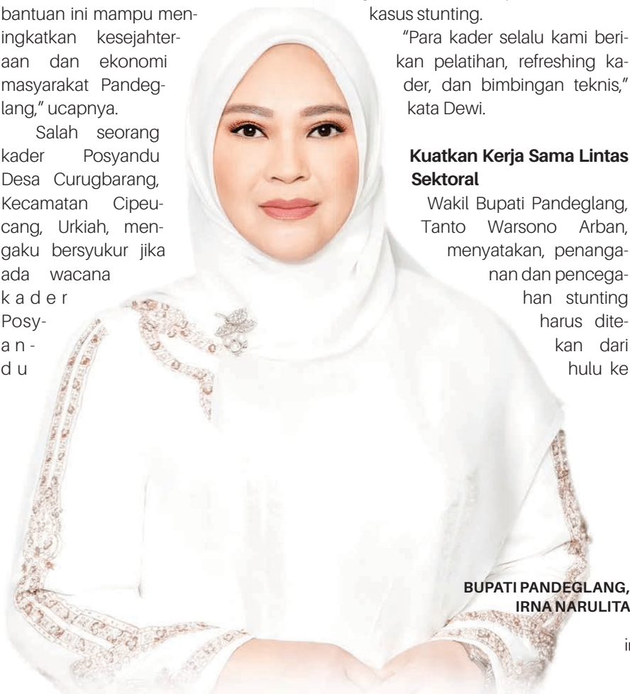
BUPATI PANDEGLANG, IRNA NARULITA

"Tanpa aksi nyata, penurunan stunting hanya ramai sebagai wacana dalam forum diskusi, tetapi sepi dalam implementasi. Oleh sebab itu, kita harus maju bersama sebagai garda terdepan dalam menurunkan stunting," tuturnya. ●