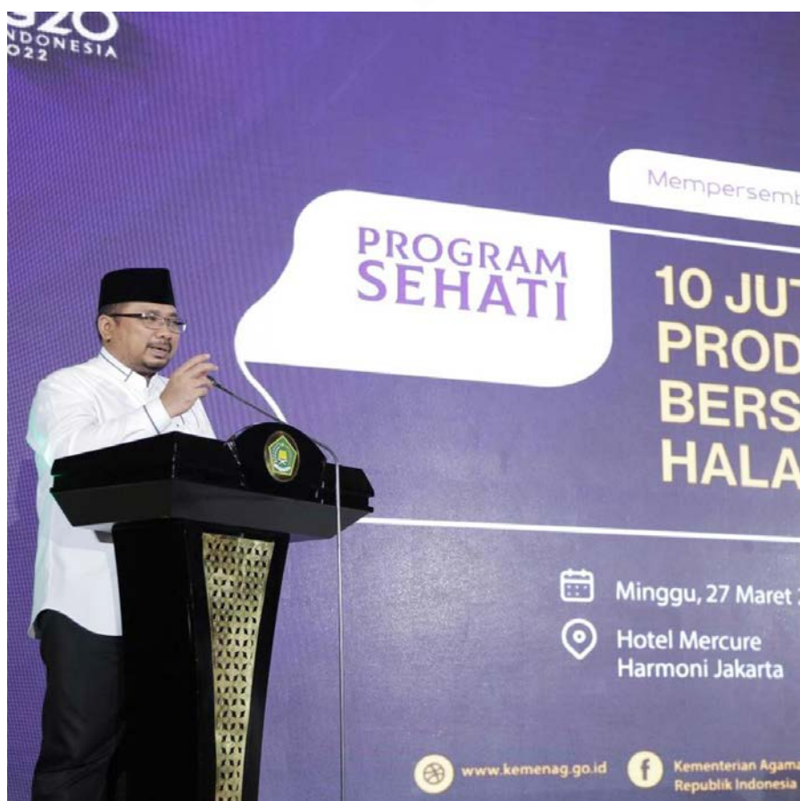
Menteri Agama, Yaqut Cholil Qoumas

Aqil Ihram menjelaskan, FHI yang berlangsung dari 14-16 Desember 2022 diisi berbagai kegiatan, di antaranya pendaftaran Sertifikat Halal Gratis (SEHATI) secara langsung di booth BPJPH, launching konsorsium laboratorium halal, halal Indonesia award 2022, halal talkshow, pameran produk halal, dan