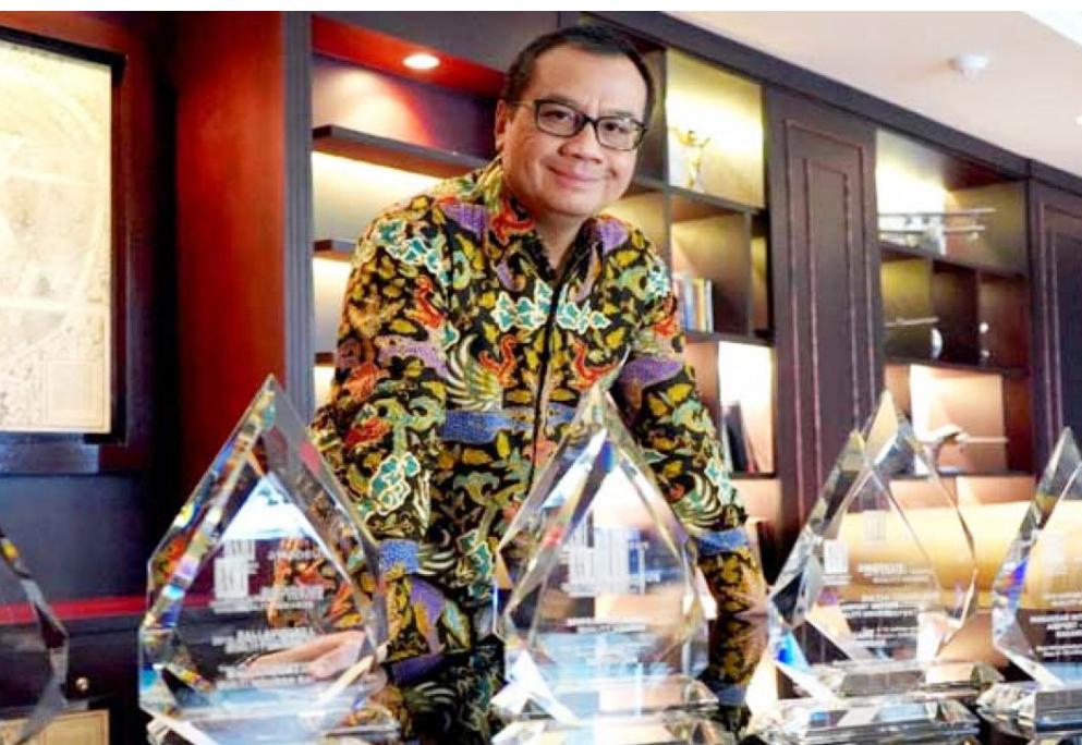
Direktur Utama Angkasa Pura I, Faik Fahmi

Irfan menjelaskan, sepanjang Desember 2022, Garuda Indonesia Group memproyeksikan dapat mengoperasikan sekitar 2.015 frekuensi penerbangan setiap minggu. Jumlah ini tumbuh 20,7 persen dibandingkan November 2022 dengan 1.670 frekuensi penerbangan per minggunya.