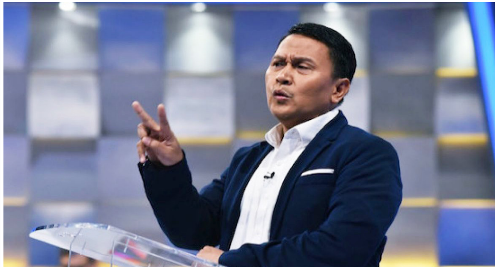
Ketua DPP Partai Keadilan Sejahtera (PKS), Mardani Ali Sera

"Kalau mau pembahasan tiga periode, jangan yang 2024. Nanti, biar fair lah kita. Kita tidak boleh membahas sesuatu yang dampaknya kepada diri kita. Tapi kalau 2024, buat saya abuse of power," ujarnya.