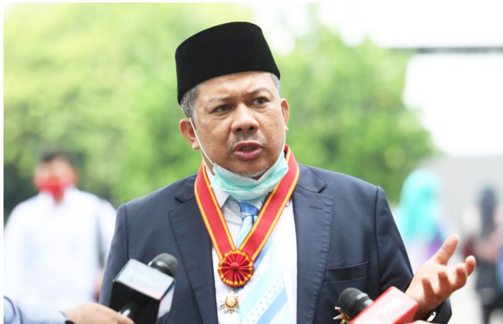
Wakil Ketua Umum Partai Gelora Indonesia Fahri Hamzah

dokumen dan akan menguraikan secara rinci alasan Partai Ummat seharusnya lolos sebagai peserta Pemilu 2024. "Dalam permohonan tersebut, kami menguraikan secara detail dan rinci mengapa Partai Ummat seharusnya lolos dan layak dijadikan peserta Pemilu 2024," ujar Denny, Jumat, 16 Desember 2022.