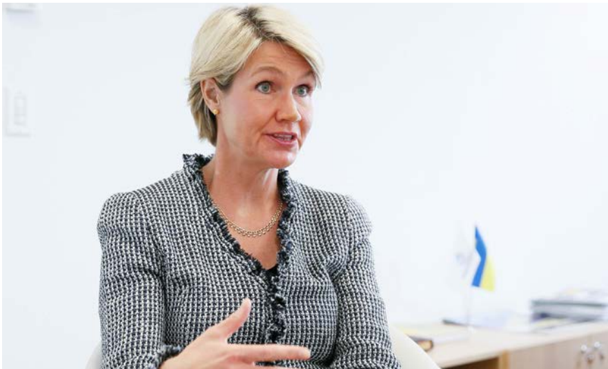
Country Director World Bank Indonesia and Timor Leste, Satu Kahkonen

Bank Dunia menyebut rasio perdagangan terhadap PDB Indonesia tu-