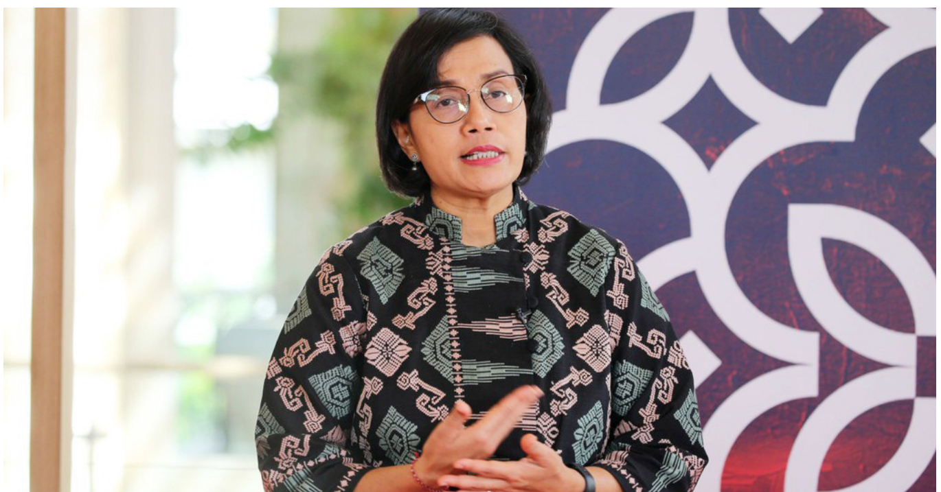
Menteri Keuangan Sri Mulyani

Satu menilai, kondisi perekonomian Indonesia tetap stabil di tengah gejolak global, namun tidak terlindung dari tekanan harga. Inflasi meningkat hingga mencapai 5,7 persen yoy pada Oktober 2022.